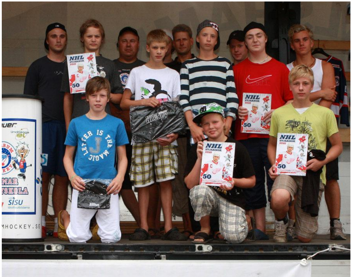
Glada vinnare i grupp 5 + målvakter. Grattis till er!!